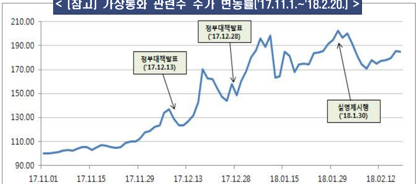
< [참고] 가상통화 관련주 주가 변동률('17.11.1.~'18.2.20.) >

* 가상통화 관련 종목의 2017.11.1. 주가를 100으로 환산하여 지수화해 산출